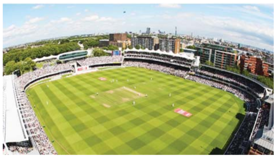
ସମୟରେ ବଲ୍ ନିକା ରହୁଥିଲା। ଏହା ଫଳରେ ବ୍ୟାଟରମାନେ ଭୀଷଣ ସମସ୍ୟାର ସମ୍ମୁଖୀନ ହୋଇଥିଲେ।

ଲଣ୍ଡନ, ୧୧: 'କ୍ରିକେଟର ଘର' କୁହାଯାଉଥିବା ଓ ଏପର୍ଯ୍ୟନ୍ତ ୧୫୦ ଟେଷ୍ଟ ମ୍ୟାଚ୍ ଆୟୋଜନ କରିସାରିଥିବା ଇଂଲଣ୍ଡର ଲଣ୍ଡନ୍ ଷ୍ଟାଡ଼ିୟମ ପିଚ୍‌କୁ ନେଇ ଅସନ୍ତୋଷ ଜାହିର କରିଛି ଆଇସିସି। ଏଥିପାଇଁ ଏହି ପଡ଼ିଆକୁ ଗୋଟିଏ 'ଡିମେରିଟ୍ ପଏଣ୍ଟ' ପ୍ରଦାନ କରାଯାଇଛି। ସେହିପରି ଅନ୍ୟାନ୍ୟ ଧାରା ଓ ସ୍ଥିର ପିଚ୍ ଲାଗି ପାକିସ୍ତାନର ଲାହୋରସ୍ଥିତ ଗଦାଫି ଷ୍ଟାଡ଼ିୟମକୁ ବି ଗୋଟିଏ 'ଡିମେରିଟ୍ ପଏଣ୍ଟ' ଦିଆଯାଇଛି। ନିକଟରେ ଖେଳାଯାଇଥିବା ଇଂଲଣ୍ଡ-ନ୍ୟୁଜିଲାଣ୍ଡ ମ୍ୟାଚ୍ ବେଳେ ପିଚ୍‌ରେ ବଲ୍‌ର ଅନିୟମିତ ସିମ୍‌ପ୍ ଦେଖିବାକୁ ମିଳିଥିଲା ଓ ଅନେକ ସମୟରେ ବଲ୍ ନିକା ରହୁଥିଲା। ଏହା ଫଳରେ ବ୍ୟାଟରମାନେ ଭୀଷଣ ସମସ୍ୟାର ସମ୍ମୁଖୀନ ହୋଇଥିଲେ।