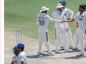
ମୁମ୍ବାଇ, ୧୧: ଆସନ୍ତା ଅଗଷ୍ଟ ୧୫ରୁ ଭାରତ ଓ ଶ୍ରୀଲଙ୍କା ମଧ୍ୟରେ ଦୁଇ ମ୍ୟାଚ୍ ବିଶିଷ୍ଟ ଟେଷ୍ଟ ଶୁଖିଲା ଆରମ୍ଭ ହେବ। ପ୍ରଥମ ଟେଷ୍ଟ ଗଲ୍‌ଠାରେ ଅଗଷ୍ଟ ୧୫ରୁ ୧୯ ପର୍ଯ୍ୟନ୍ତ ଖେଳାଯିବ। ଦ୍ୱିତୀୟ ଟେଷ୍ଟ ପାଇଁ ସ୍ଥାନ ରୁହାନ୍ତ ହୋଇନଥିଲେ ବି ଏହା ଅଗଷ୍ଟ ୨୩ରୁ ଆରମ୍ଭ ହେବ। ଟେଷ୍ଟ ଏହା କଲ୍ୟାଣ ସିଂହଲିଙ୍କ ଷୋର୍ଟ୍ କୁଲ୍‌ରେ ଖେଳାଯିବାର ସମ୍ଭାବନା ରହିଛି। ସ୍ଥାନ ରୁହାନ୍ତ