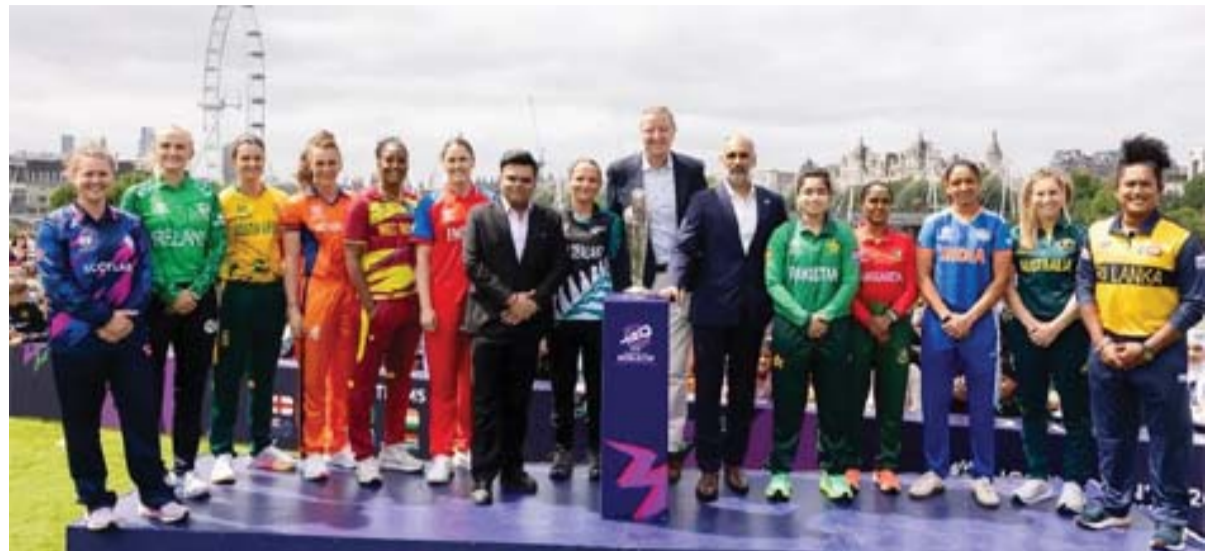
ଇଂଲଣ୍ଡ ଦ୍ୱିତୀୟ ଥର ଏହି ପ୍ରତିଯୋଗିତାର ଆୟୋଜନ ଅଧିକାର ପାଇଛି। ଏହି ପ୍ରତିଯୋଗିତାରେ ନେଦରଲାଣ୍ଡସ ପ୍ରଥମ ଥର ଖେଳିବାକୁ ଯୋଗ୍ୟତା ଅର୍ଜନ କରିଛି। ଯୁଏରରେ ଆୟୋଜିତ ୨୦୨୪ ପାଇନାଲରେ ଦକ୍ଷିଣ ଆଫ୍ରିକାକୁ ହରାଇ ନ୍ୟୁଜିଲାଣ୍ଡ ପ୍ରଥମ ଥର ପ୍ରତିଯୋଗିତାରେ ନେଦରଲାଣ୍ଡସ ପ୍ରଥମ ଥର ଖେଳିବାକୁ ଯୋଗ୍ୟତା ଅର୍ଜନ କରିଛି। ଯୁଏରରେ ଆୟୋଜିତ ୨୦୨୪ ପାଇନାଲରେ ଦକ୍ଷିଣ ଆଫ୍ରିକାକୁ ହରାଇ ନ୍ୟୁଜିଲାଣ୍ଡ ପ୍ରଥମ ଥର ପ୍ରତିଯୋଗିତାରେ ନେଦରଲାଣ୍ଡସ ପ୍ରଥମ ଥର ଖେଳିବାକୁ ଯୋଗ୍ୟତା ଅର୍ଜନ କରିଛି।

ବର୍ମିଂହାମ୍, ୧୧: ଗୁରୁବାର ମଧ୍ୟ ରାତ୍ରରେ ପୁରୁଷ ଫିଫା ବିଶ୍ୱକପ୍ ଆରମ୍ଭ ହୋଇଥିଲା ବେଳେ ମହିଳା ଟ୍ରେଣିଂ-୨୦ ବିଶ୍ୱକପ୍ର ଦଶମ ସଂସ୍କରଣ ଶୁକ୍ରବାରଠାରୁ ଇଂଲଣ୍ଡର ୭ଟି ଭେନ୍ୟୁରେ ଖେଳାଯିବ। କ୍ରୀଡ଼ା ଚଳଚ୍ଚିତ୍ର ପର୍ଯ୍ୟନ୍ତ ଚାଲିବାକୁ ଥିବା ଏହି ପ୍ରତିଯୋଗିତାରେ ୧୨ ଦଳ ଅଂଶଗ୍ରହଣ କରୁଥିବା ବେଳେ ମୋଟ ୩୩ ମ୍ୟାଚ୍ ଖେଳାଯିବ। ୧୨ ଦଳକୁ ୨ଟି ଗ୍ରୁପ୍ରେ ବିଭକ୍ତ କରାଯାଇଛି।