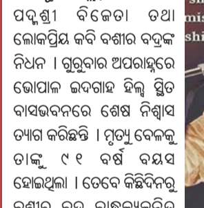
ନୂଆଦିଲ୍ଲୀ, ୧୧: ପଦ୍ମଶ୍ରୀ ବିଜେତା ତଥା ଲୋକପ୍ରିୟ କବି ବଶୀର ବଦ୍ରଙ୍କ ନିଧନ। ଗୁରୁବାର ଅପରାହ୍ନରେ ତାଙ୍କର ପରଲୋକ ଘଟିଥିଲା। ବଶୀର ବଦ୍ର ବାସକରନରେ ଶେଷ ନିଶ୍ୱାସ ତ୍ୟାଗ କରିଛନ୍ତି। ମୃତ୍ୟୁବେଳେ ତାଙ୍କୁ ୯୧ ବର୍ଷ ବୟସ ହୋଇଥିଲା। ଟେଷ୍ଟ କିଛିଦିନ ବଶୀର ବଦ୍ର ବାସକରନରେ ରୋଗରେ ପୀଡ଼ିତ ଥିଲେ। ଦୀର୍ଘଦିନରୁ ଅସୁସ୍ଥ ଥିଲେ। ତାଙ୍କ ନିଧନରେ ବଲିଉଡର ସଂଗୀତକାର ଜାଭେଦ ଅଖତର ଦୁଃଖ ପ୍ରକାଶ କରିଛନ୍ତି। ସେ ସୋସିଆଲ ମିଡ଼ିଆରେ ଶ୍ରଦ୍ଧାଞ୍ଜଳି ଜଣାଇଛନ୍ତି। ବଶୀର ବଦ୍ର ଗୋପାଳନ କବି ଜଗତରେ ସବୁଠାରୁ ଲୋକପ୍ରିୟ ଏବଂ ସରଳ କବି ମଧ୍ୟରେ ଅନ୍ୟତମ। ତାଙ୍କ ପ୍ରକୃତ ନାମ ସିୟୋଦ ମହମ୍ମଦ ବଶୀର ଥିଲା। ୧୯୩୫ରେ ତାଙ୍କ ଜନ୍ମ ହୋଇଥିଲା। ଦୀର୍ଘଦିନରୁ ସେ ତିନେନସିଆ ରୋଗରେ ପୀଡ଼ିତ ଥିଲେ। ତାଙ୍କ ପୁରୁଣ ଶକ୍ତି ଚାଲିଯାଇଥିଲା। ସେ ନିଜ ଲୋକକୁ ଚିହ୍ନି ପାରୁନଥିଲେ। କିଛିଦିନରୁ ତାଙ୍କ ଦେହ ଖରାପ ହୋଇଚାଲିଥିଲା। ଟେଷ୍ଟ ତାଙ୍କ ଅଧିକ ସଂସ୍କାର କେବେ କରାଯିବ ତାହା ଏଯାବତ୍ ଜଣାପଡିନାହିଁ। କିନ୍ତୁ ପରିବାର ଲୋକଙ୍କ କହିବାନୁସାରେ, ଆଜି ସନ୍ଧ୍ୟା ସୁଦ୍ଧା ତାଙ୍କ ଅଧିକ ସଂସ୍କାର କରାଯାଇପାରେ। ବଶୀର ବଦ୍ରଙ୍କ ପରଲୋକ, ଏକାକୀ, ଏପର୍ଯ୍ୟ, ସ୍ମୃତି ପାଇଁ କବିତା ରଖିଥିଲେ। ବଶୀର ବଦ୍ରଙ୍କ ଲୋକପ୍ରିୟ କବିତା ପଢ଼ିବା ପଢ଼ିବା ଲୋକପ୍ରିୟରେ ଭାରତର ହେଉଛି । ' କୁହ ତ ମଜବୁତା ରହି ହୋଗା, ଯୁଁ କୋଇ ବେବତା ନେହିଁ ହୋଗା' ।