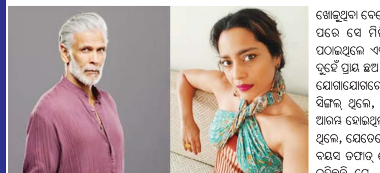
ମୁମ୍ବାଇ, ୧୧: ଅଭିନେତ୍ରୀ ଶାହନା ଗୋସ୍ୱାମୀ ସମ୍ପ୍ରତି ମତେଲ୍ ଓ ଅଭିନେତା ମିଲିମ ସୋମନଙ୍କ ସହ ତାଙ୍କ ପୁରୁଣା ପ୍ରେମ ସମ୍ପର୍କ ନେଇ ଖୋଲାମାନରେ ଆଲୋଚନା କରିଛନ୍ତି। ସେ କହିଛନ୍ତି ଯେ, କିଶୋରୀ ବୟସରୁ ମିଲିମଙ୍କୁ ପସନ୍ଦ କରୁଥିଲେ ଏବଂ ପରେ ଦୁହେଁଙ୍କ ମଧ୍ୟରେ ପ୍ରେମ ସମ୍ପର୍କ ଗଢ଼ି ଉଠିଥିଲା। ଶାହନା କହିଛନ୍ତି, ସେତେବେଳେ ସେ ଦିଲ୍ଲୀରେ ପଢୁଥିଲେ ଏବଂ ମିଲିମ ଗୋଟିଏ ଫିଲ୍ମ ଦେଖିବା ପରେ ତାଙ୍କ ଅଭିନୟରେ ଖୁବ୍ ପ୍ରଭାବିତ ହୋଇଥିଲେ। ଫିଲ୍ମ ଦେଖିବା ପରେ ସେ ମିଲିମଙ୍କ ବଡ଼ ପ୍ୟାଟ୍ ହୋଇଯାଇଥିଲେ। ଶାହନା କହିଛନ୍ତି ଯେ, ସେ ଇଣ୍ଡିଆନରେ ମିଲିମଙ୍କ ଠିକଣା

ନେଇନଥିଲେ ଏବଂ ସେ ନିଜ ବୟସ ଠାରୁ ଅଧିକ ପରିଚୟ ଥିଲେ। ଶାହନା କହିଛନ୍ତି ଯେ, ୨୦୧୩ରେ ଦୁହେଁଙ୍କ ମଧ୍ୟରେ ଚୁକ୍ତି ହୋଇଥିଲା। ସେ କହିଛନ୍ତି, ସମ୍ପର୍କରେ ସଠିକ୍ ତାଳମେଳ ନଥିଲେ ଏହାକୁ ଛାଡ଼ିଦେବା ଭଲ। ତଥାପି ଶେଷ ପର୍ଯ୍ୟନ୍ତ ଦୁହେଁ ପରସ୍ପରକୁ ଭଲପାଉଥିଲେ। ଶାହନା କହିଛନ୍ତି ଯେ, ସେ ପ୍ରେମରେ ଗଭୀର ବିଶ୍ୱାସ କରନ୍ତି, କିନ୍ତୁ ସ୍ୱାଧୀନତାକୁ ମଧ୍ୟ ସମାନ ଗୁରୁତ୍ୱ ଦିଅନ୍ତି। କାହାକୁ ବନ୍ଧନରେ ରଖିବାକୁ ସେ ପ୍ରେମ ମାନନ୍ତି ନାହିଁ। ଉଲ୍ଲେଖଯୋଗ୍ୟ, ମିଲିମ ସେମାନ ୨୦୧୮ ମସିହାରେ ଅକିତା କୁଁସୁରକୁ ବିବାହ କରିଥିଲେ।