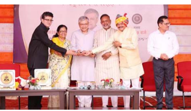
ଡିଜିଟାଲ୍ ଯୁଗରେ ରେଡିଓର ପ୍ରାସଙ୍ଗିକତା ବଜାୟ ରଖିବାକୁ ସ୍ଥାନୀୟ ପ୍ରସଙ୍ଗକୁ ପ୍ରାଥମିକତା ଦେବା ଆବଶ୍ୟକ: ଅଶ୍ଵିନୀ ବୈଷିକ

ନୂଆଦିଲ୍ଲୀ, ୧୧.୬ (ପିଆଇବି) : କେନ୍ଦ୍ର ରେଳ, ପୁରୀ ଏବଂ ପ୍ରସାରଣ ଏବଂ ଇଲେକ୍ଟ୍ରୋନିକ୍ସ ଏବଂ ପୁରୀ ପ୍ରଯୁକ୍ତି ମନ୍ତ୍ରାଳୟର ଉପାଧ୍ୟକ୍ଷ ଆଜି ଆକାଶବାଣୀ କନ୍ଦମ୍ବର ପରିସରକୁ କନ୍ଦମ୍ବର ମେଳଣ ରାମଗଡ଼ରେ ୨୦ କିଲୋଡ଼ାର ଏଫଏମ୍ ଆକାଶବାଣୀ ଏଫଏମ୍ ଟ୍ରାନ୍ସମିଟରର ଉଦ୍ଘାଟନ କରିଛନ୍ତି।